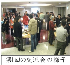
第1回の交流会の様子

各マンションではラウンジなどの共用施設などを見学します。その後、レジデンス・ザ・武蔵小杉で参加者のみなさんと懇親会を行います。原則、大人の方のみの参加とさせていただきます。お子様と一緒に参加される場合は事前にお知らせ下さい。ベビーカーは自己管理参加をお願いします。