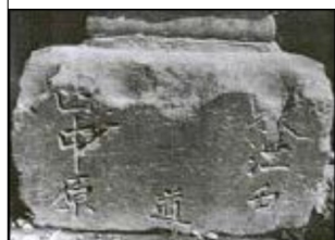
供養塔礎石 西中原・東江戸

馬方や旅をする人が集まったので、旅に必要な食料や品物も売ってました。」と言っています。