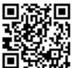
入会はこのQRコードで

お申込先: 044-433-9180(エリマネ事務局)、申込締切: 7月9日まで