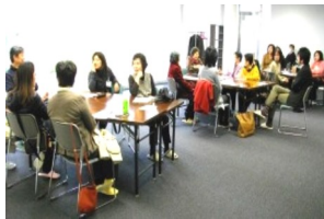
ちょっと小さな交流会

(場所: エリマネ横のフリースペース)動きやすい服装、飲み物を持参してお出かけ下さい。