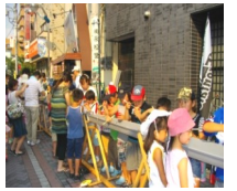
昨年のそうめん流し

参加方法: イベント前日までに牛乳パック5枚をもってレディースショップ「アラセ」で法政通り商品券(千円分)を購入すると、大そうめん流しの参加券がもらえます。商品券は8月末まで有効で法政通り全店で使用できます。参加券がない方は、当日会場受付で現金200円で、参加できます。