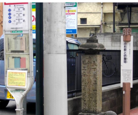
現在のかぎの道バス停横の供養塔