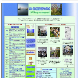
新ホームページのトップ

その後の交流タイムは、5人くらいのグループに分かれ、小杉の七福神の話やマンシヨンの衣類の収納方法などの話など、楽しい話題で盛り上がっていました。